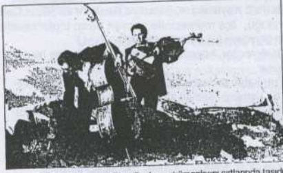
Orkestra üyeleri 400 metrelik patikada enstrümanlarını sırtlarında taşıdı.

K OMMEGENE Kralı I'inci Antinehos'un, "Bura-ya gelen yerli ve yabancı ahaliyi büyük bir ihtimamla karşılamalı, herkesin eşit derecede keyif alacağı bir şölen hazırlanmalıdır. Burayı insanların eğlenip ibadet etmesi için yaptır-dım" şeklindeki vasiyeti tam 2 bin yıl sonra yerine geldi.