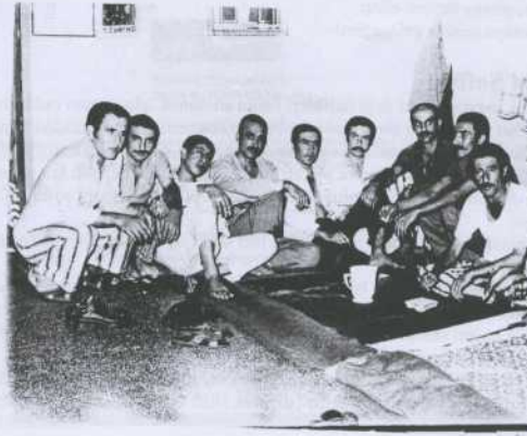
Tarihten bir an...

Göteborg, 31.10.2004 Hamzademir@hotmail.com